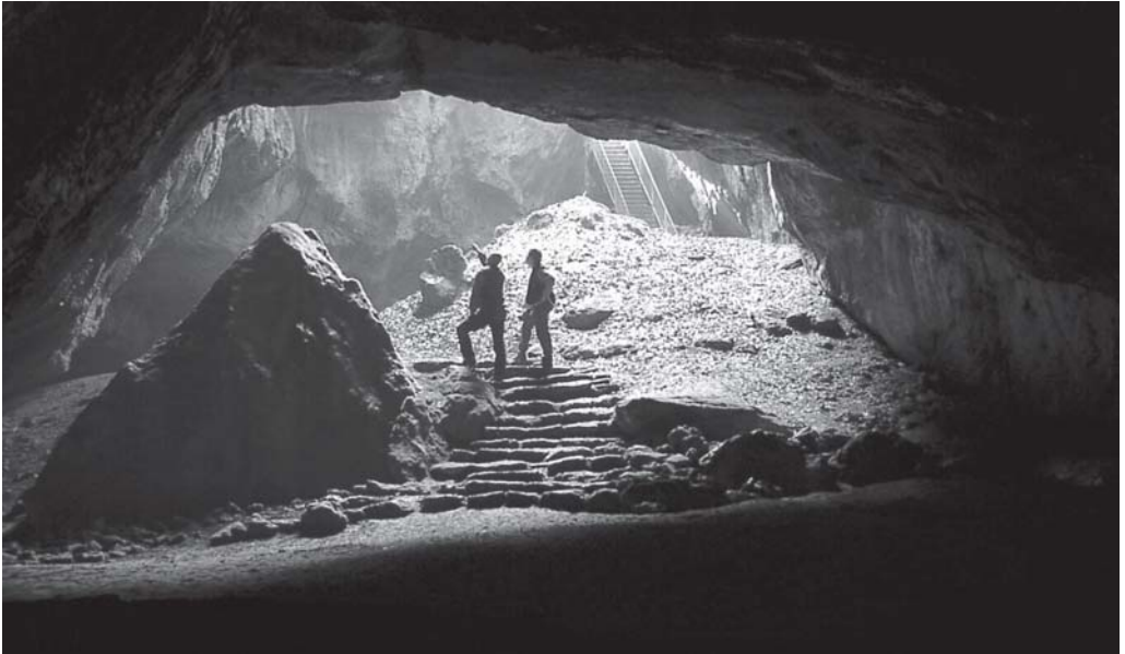
Die „Blaue Grotte“ in der Einhornhöhle