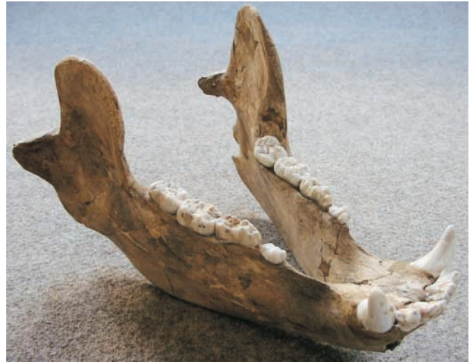
Abb. 2: Vollständiger Unterkiefer eines Höhlenbären (ca. 30.000 Jahre alt, Länge ca. 30 cm)

www.nlfb.de , www.geotope-niedersachsen.de www.dgg.de , www.geo-top.de , www.geotope.de www.geoakademie.de ; www.einhornhoehle.de