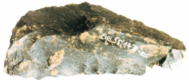
Abb. 3: ca. 100.000 Jahre altes Werkzeug des Neandertalers: Schaber (Größe 2 x 5 cm)